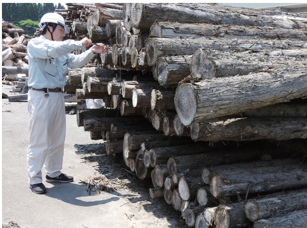
FAKOPPを用いた両木口間のSPT計測